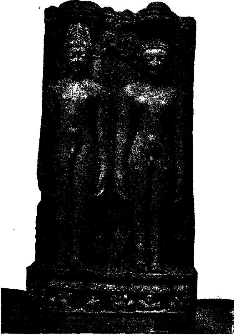
श्री आदितीर्थकर वृषभदेव और अंतिम तीर्थकर भ. महावीर वर्द्धमान।